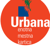
Podoba enotne mestne kartice

Terminska kartica URBANA je zelene ali rumene barve (kartico rumene barve izdaja v Mestna knjižnica Ljubljana), izdana je na ime in priimek, ni prenosna. Nanjo se lahko naloži izbrana mesečna, letna ali prenosna letna vozovnica in dobroimetje.